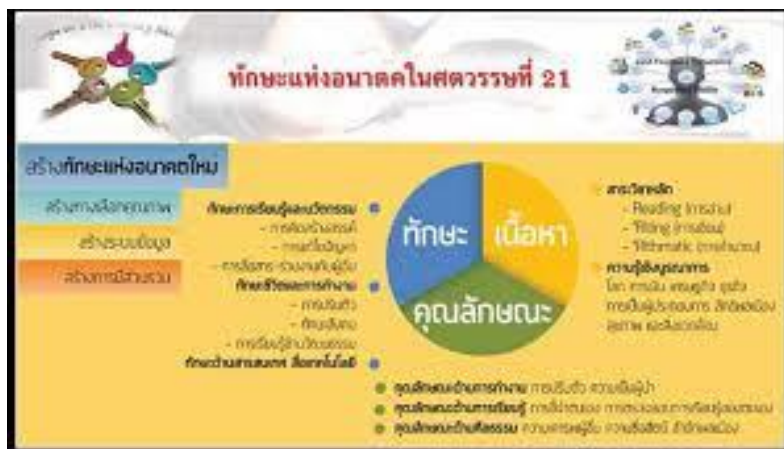
ภาพที่ 2 ทักษะแห่งอนาคตในศตวรรษที่ 21 ( https://www.google.com )